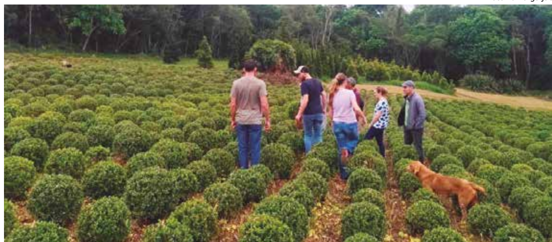
A ideia é que, com o apoio da Prefeitura, a USP analise iniciativas recentes que foram propostas pelo poder público